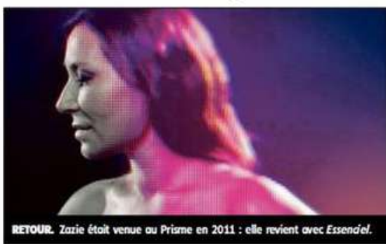
RETOUR. Zazie était venue au Prisme en 2011 : elle revient avec Essenc'el .

Dimanche 23 : Manu Lanvin and the Devil Blues à 15 heures ; Elmer Food Beat à 16 h 30 ;